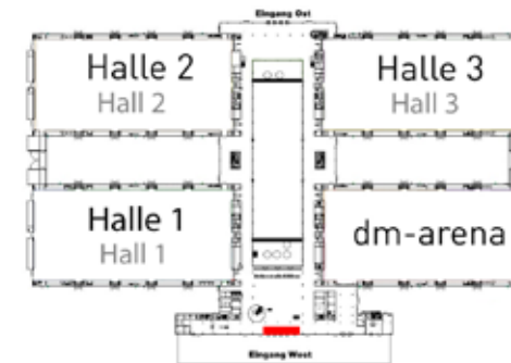
Platzierungsmöglichkeit auf dem Messegelände

E-Mail: marc-oliver.dopf@messe-karlsruhe.de