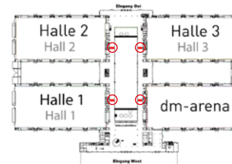
Platzierungsmöglichkeit auf dem Messegelände

Sie möchten weitere Informationen? Oder dieses Angebot buchen? Dann melden Sie sich bei uns: