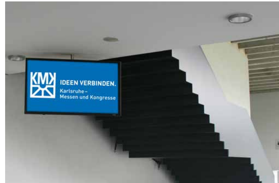
Einsatzbeispiel – Eingang Ost

*Die Laufzeit der elektronischen Werbemedien beträgt ca. 10 Std./Tag, die Spots haben mind. 120 Wiederholungen/Tag. Wir sind Ihnen gerne bei der Erstellung eines professionellen Spots behilflich. Hinweis: Die o. g. Preise für Produktionen setzen eine termingerechte Lieferung der Daten im entsprechenden Format voraus. Ein Datenblatt geht Ihnen nach Auftragserteilung zu. Sollten Sie von unserem Produktions-Service keinen Gebrauch machen wollen, senden Sie bitte Ihre fertigen Spots bis spätestens zwei Wochen vor Messebeginn an den unten genannten Kontakt. Die ggf. nötige Nachbearbeitung oder Optimierung wird gesondert angeboten.