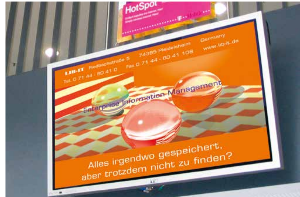
Einsatzbeispiel – Haupteingang

*Die Laufzeit der elektronischen Werbemedien beträgt ca. 10 Std./Tag, die Spots haben mind. 120 Wiederholungen/Tag. Wir sind Ihnen gerne bei der Erstellung eines professionellen Spots behilflich. Hinweis: Die o. g. Preise für Produktionen setzen eine termingerechte Lieferung der Daten im entsprechenden Format voraus. Ein Datenblatt geht Ihnen nach Auftragserteilung zu. Sollten Sie von unserem Produktions-Service keinen Gebrauch machen wollen, senden Sie bitte Ihre fertigen Spots bis spätestens zwei Wochen vor Messebeginn an den unten genannten Kontakt. Die ggf. nötige Nachbearbeitung oder Optimierung wird gesondert angeboten.