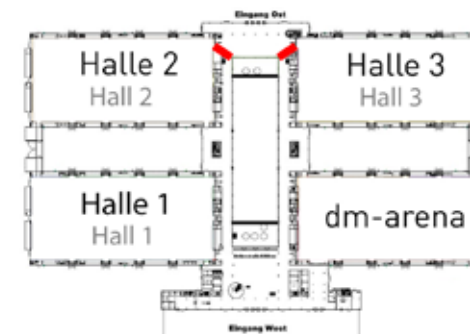
Platzierungsmöglichkeit auf dem Messegelände