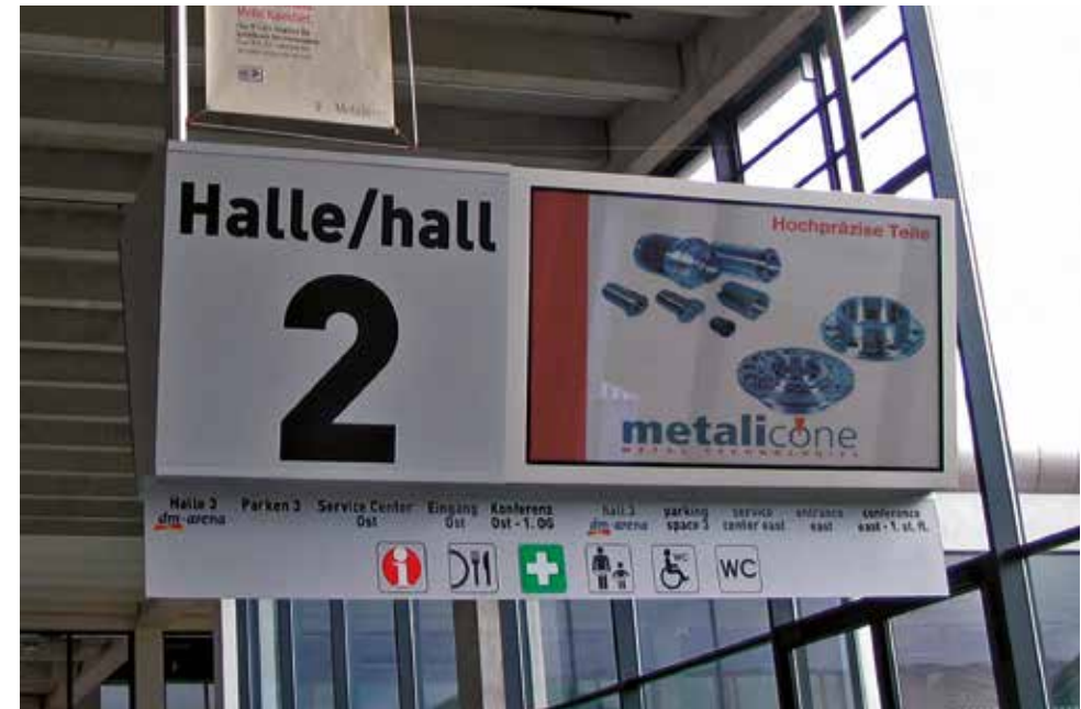
Einsatzbeispiel – Besucherrundgang Eingang Halle 2

*Die Laufzeit der elektronischen Werbemedien beträgt ca. 10 Std./Tag, die Spots haben mind. 120 Wiederholungen/Tag. Wir sind Ihnen gerne bei der Erstellung eines professionellen Spots behilflich. Hinweis: Die o. g. Preise für Produktionen setzen eine termingerechte Lieferung der Daten im entsprechenden Format voraus. Ein Datenblatt geht Ihnen nach Auftragserteilung zu. Sollten Sie von unserem Produktions-Service keinen Gebrauch machen wollen, senden Sie bitte Ihre fertigen Spots bis spätestens zwei Wochen vor Messebeginn an den unten genannten Kontakt. Die ggf. nötige Nachbearbeitung oder Optimierung wird gesondert angeboten.