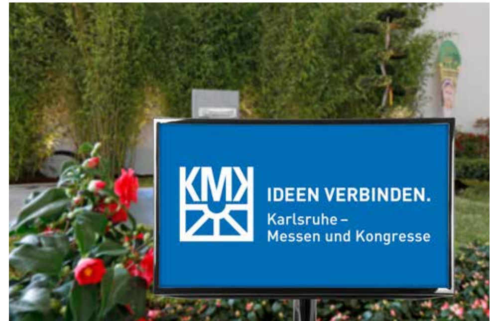
Einsatzbeispiel – Besucherrundgang

*Die Laufzeit der elektronischen Werbemedien beträgt ca. 10 Std./Tag, die Spots haben mind. 120 Wiederholungen/Tag. Wir sind Ihnen gerne bei der Erstellung eines professionellen Spots behilflich. Hinweis: Die o. g. Preise für Produktionen setzen eine termingerechte Lieferung der Daten im entsprechenden Format voraus. Ein Datenblatt geht Ihnen nach Auftragserteilung zu. Sollten Sie von unserem Produktions-Service keinen Gebrauch machen wollen, senden Sie bitte Ihre fertigen Spots bis spätestens zwei Wochen vor Messebeginn an den unten genannten Kontakt. Die ggf. nötige Nachbearbeitung oder Optimierung wird gesondert angeboten. Die Platzierung der mobilen Displays obliegt der Karlsruher Messe- und Kongress-GmbH.