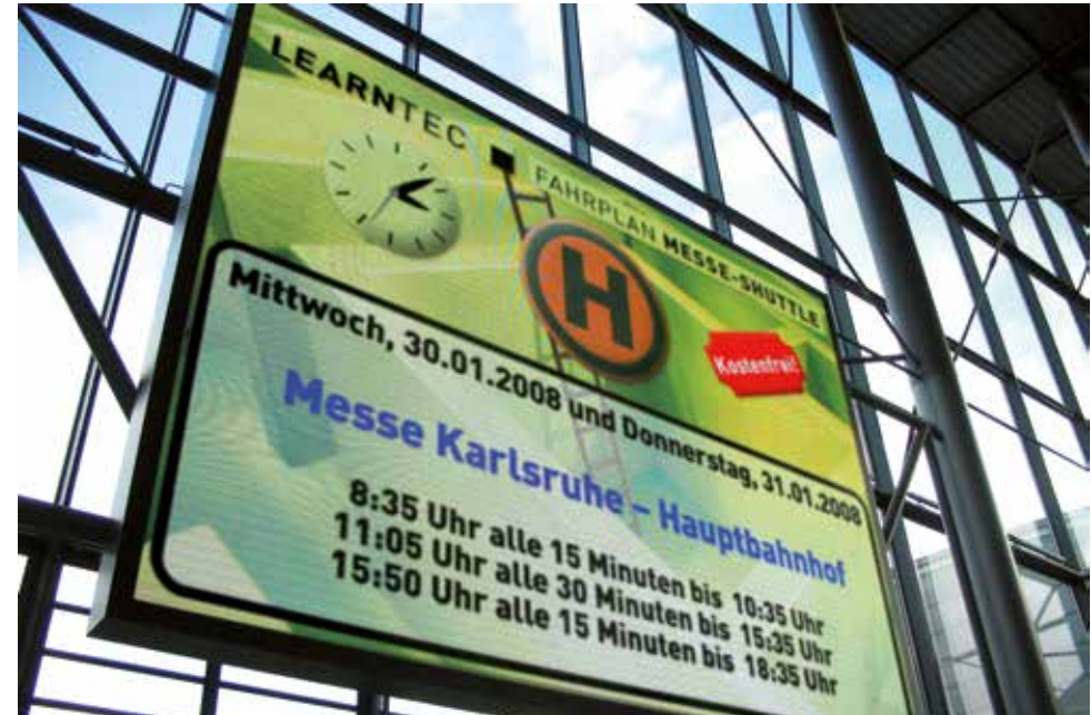
Einsatzbeispiel – Aktionshalle

*Die Laufzeit der elektronischen Werbemedien beträgt ca. 10 Std./Tag, die Spots haben mind. 120 Wiederholungen/Tag. Wir sind Ihnen gerne bei der Erstellung eines professionellen Spots behilflich. Hinweis: Die o. g. Preise für Produktionen setzen eine termingerechte Lieferung der Daten im entsprechenden Format voraus. Ein Datenblatt geht Ihnen nach Auftragserteilung zu. Sollten Sie von unserem Produktions-Service keinen Gebrauch machen wollen, senden Sie bitte Ihre fertigen Spots bis spätestens zwei Wochen vor Messebeginn an den unten genannten Kontakt. Die ggf. nötige Nachbearbeitung oder Optimierung wird gesondert angeboten.